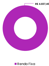
Carteira Prev-Mais - R$ Outubro/2023